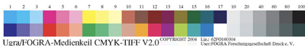
Рис.1. Тестовая шкала UGRA/FOGRA MediaWedge v.2.0.