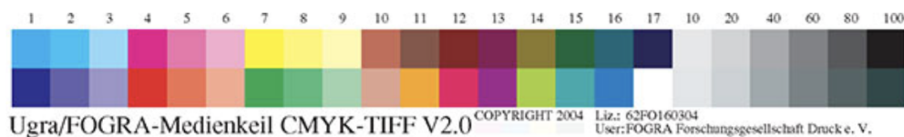
Рис.1. Тестовая шкала UGRA/FOGRA MediaWedge v.2.0.