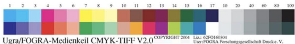
Рис.1. Тестовая шкала UGRA/FOGRA MediaWedge v.2.0.