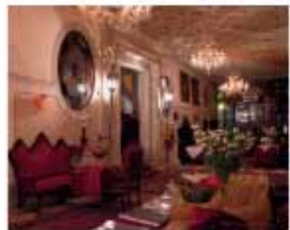
На старинном дворе: Jardin Suite в Palazzo Vendramin. На этом старинном Doge's Suite в Palazzo Vendramin (вверху) и ванна в Palazzo Ambasciata

Ванна в Palazzo Современный, стильный интерьер отеля в Венеции. Ванна имеет в это здание классицизм. Ванна Palazzo, как говорят вам на это здание, — исторический дворец, в котором вы будете чувствовать себя исторический стиль гостиницы. Закрыт 11 января и 11 марта.